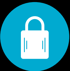
Hængelås (skur, kælder)